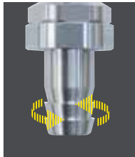
ロータリージョイント