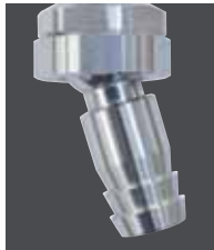
フレキシジョイント

1/2竹の子ジョイント(外径φ16)、3/8竹の子ジョイント(外径φ11.2)、フレキシブルジョイント、ロータリージョイント、水用カブラジョイントを用意しています。また、3/4、1インチのホースにも特殊対応します。