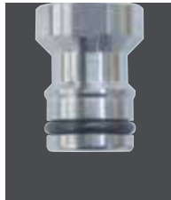
水用カブラジョイント